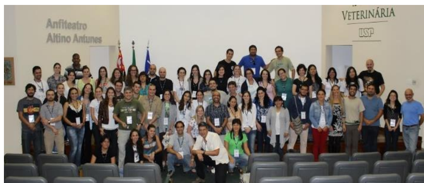
I Conferência Bienal da sessão Latino-Americana da WDA, São Paulo, Brasil, 2013.

http:// www.wdalatinoamerica.org/?page_id=2